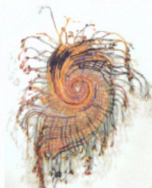
Ci-dessus Odon, Patience de Potok , 1991, kraft peint et tissé CHÂTEAU MUSÉE

« COULEURS ET MURMURES », palais de l'Europe, 04 92 41 76 66, du 8 avril au 24 septembre.